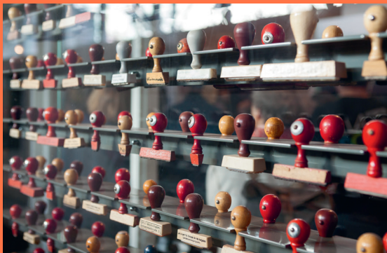
Stempel-Installation, 2017

Am authentischen Ort dokumentiert die Dauerausstellung Ursachen, Verlauf und Folgen der deutsch-deutschen Fluchtbewegung. Sie spannt den Bogen von der Entscheidung zum Verlassen der DDR bis zum Ankommen in der westdeutschen Gesellschaft. Zu sehen sind über 900 Objekte – darunter zahlreiche Originaldokumente, Fotos und Gegenstände von Flüchtlingen und Ausgereisten. Medienstationen geben vertiefende Einblicke in ihre Biografien, die in Beziehung zu politischen Entwicklungen gesetzt werden. Eine rekonstruierte Unterkunft mit Originalmobilar aus den 1950er Jahren veranschaulicht die Lebensumstände im Notaufnahmelaager.