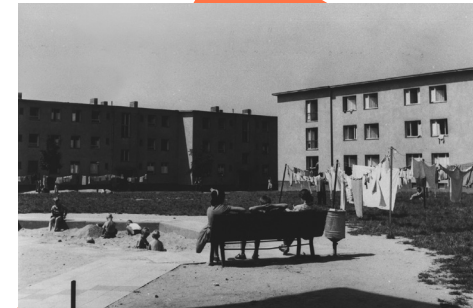
Außen 1, 1961