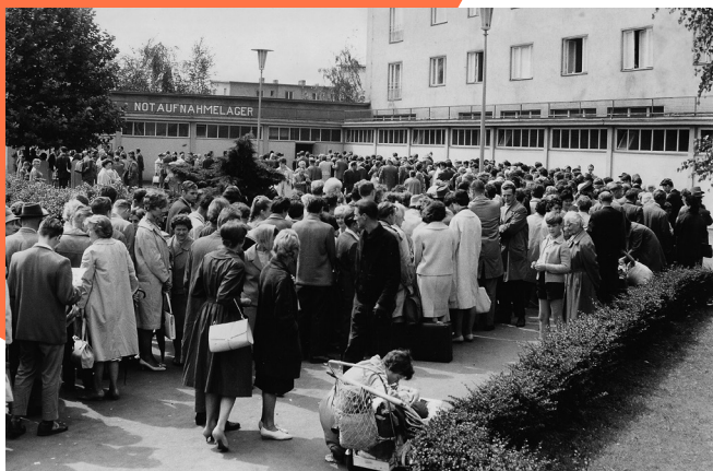
Warteschlange, 1961