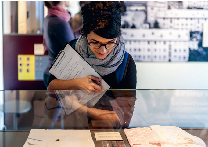
Ausstellung, Foto: Kerstin Klupsch, 2017 © Stiftung Berliner Mauer