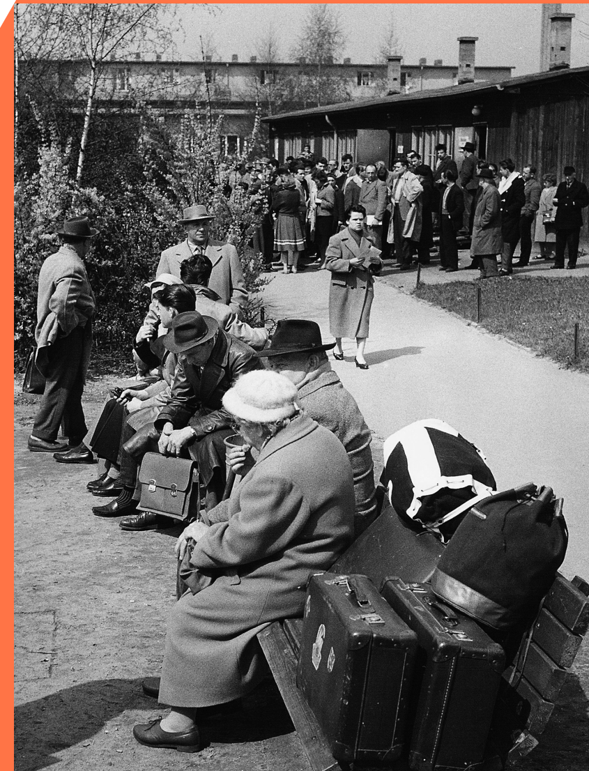
Außen 2, 1960