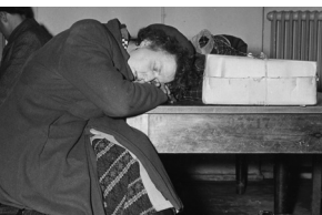
Schlafende Frau im Warteraum, 1956